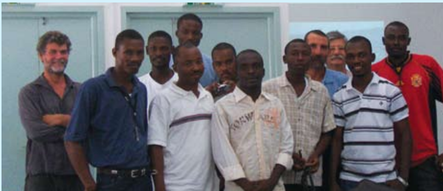
Agwonòm yo ki andan pwojè a nan yon fòmasyon sou DCP nan peyi Gwadeloup nan mwa jen 2008 la. Agwonòm sa yo ak lòt espè lokal tankou rejyonal pral gen pou fè fòmasyon pou pechè yo.

Fòmasyon pou pechè ak machann pwason yo. Pwojè a konnen enpòtan fòmasyon genyen pou pechè ak machann yo. Se pou sa, avan li fè yo jwenn fòmasyon yo, sou divès sijè ki gen avèk ak pèch, tankou sou teknik pèch ak DCP ak sou tretman pwason, li vle pou asosyasyon pechè yo jwe wòl yo tout bon vre andan pwojè a. Nan sans sa a, pwojè a te oganize