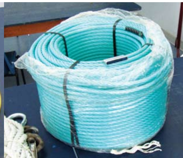
Foto yon tip flotè ak yon roulo kòd (ki fèt ak melanj asye ak polipwopilèn) DCP yo ki pral poze nan sidès la.