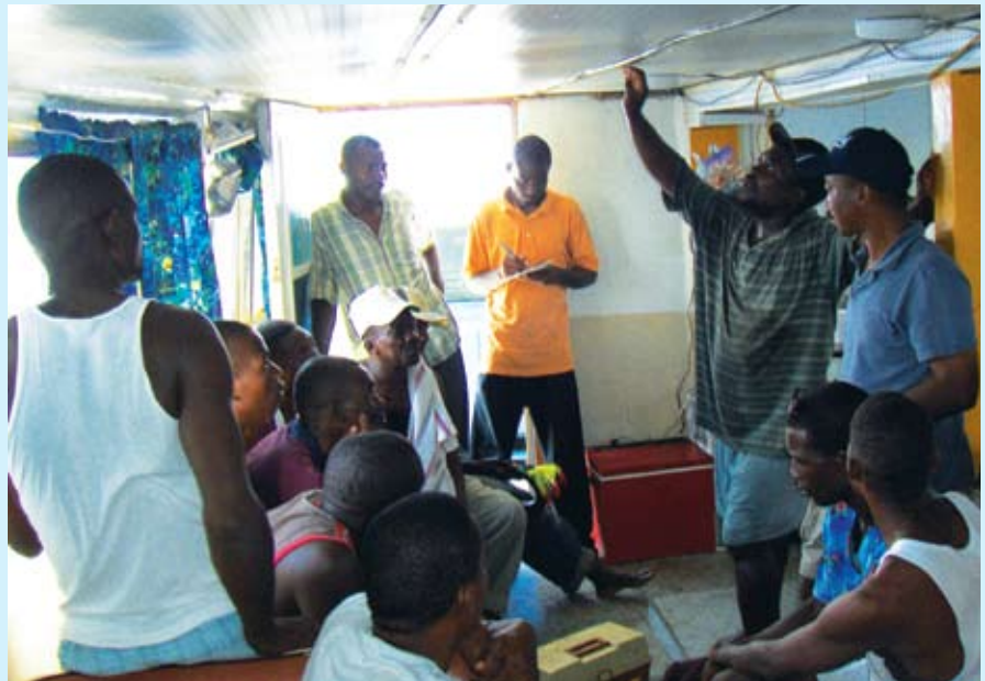
Bwase lide sou pèch sou DCP yo ant pechè sidès ak pechè ki sòti nan komin Abriko, nan depatman Grandans la.

gen chans eseye l pou wè si modèl sa a ap bon pou pechè yo.