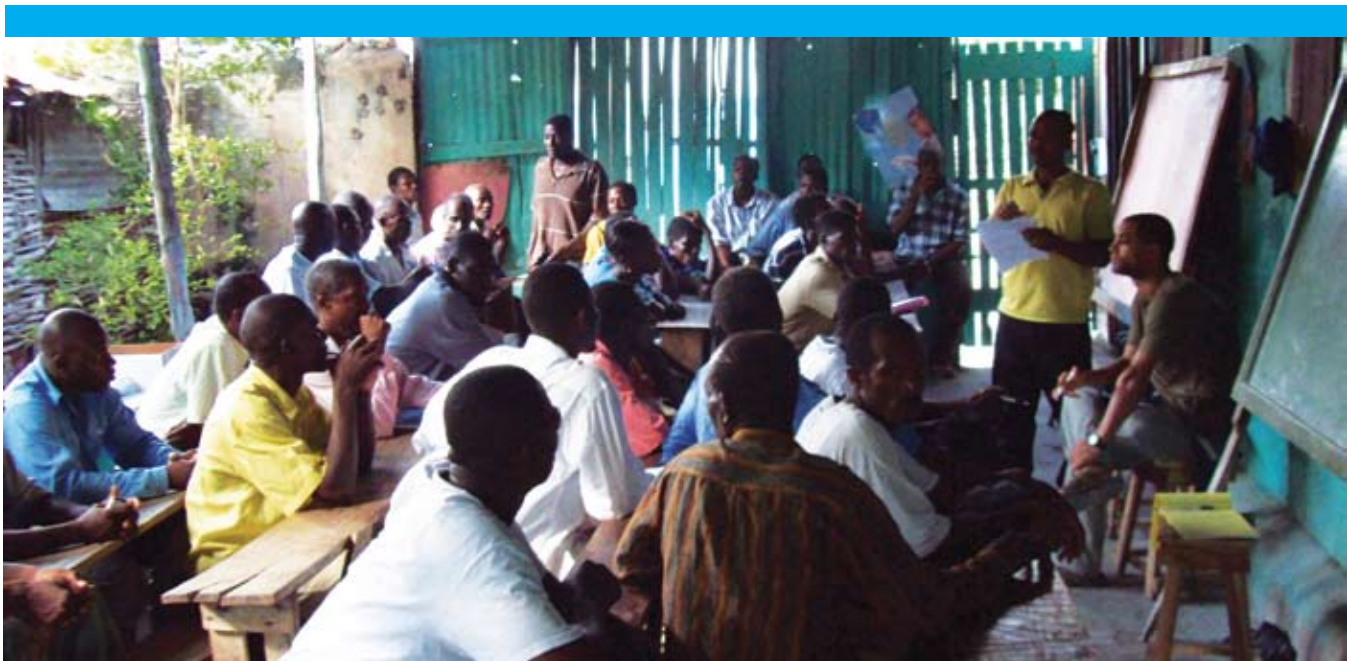
Chita pale ant Direksyon pwojè a ak reprezantan asosyasyon pechè ak machann yo nan komin Bèlans pou diskite sou CCS la.

• Jwenn kèk mezi pou anpeche materyèl yo pèdi ak pou redwi dega siklòn konn fè