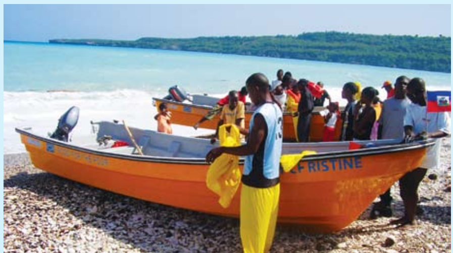
Sa se modèl anbakasyon « food for the Poor » a, anpil reprezantan asosyasyon pechè sidès yo pi renmen an. 38 nan bato sa yo (18 ak 22 pye) pral disponib pou asosyasyon pechè sidès yo nan kòmansman seson été a. Èd sa sòti nan men Xunta de Galicia ak pwojè a.