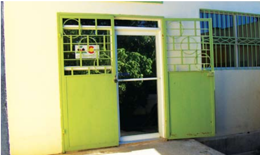
Fasad deyò biwo pwojè a ki nan DDASE, vil jakmèl, pwojè a te fè yon pase men ladann pou l te kapab fè l sèvi biwo santral li.