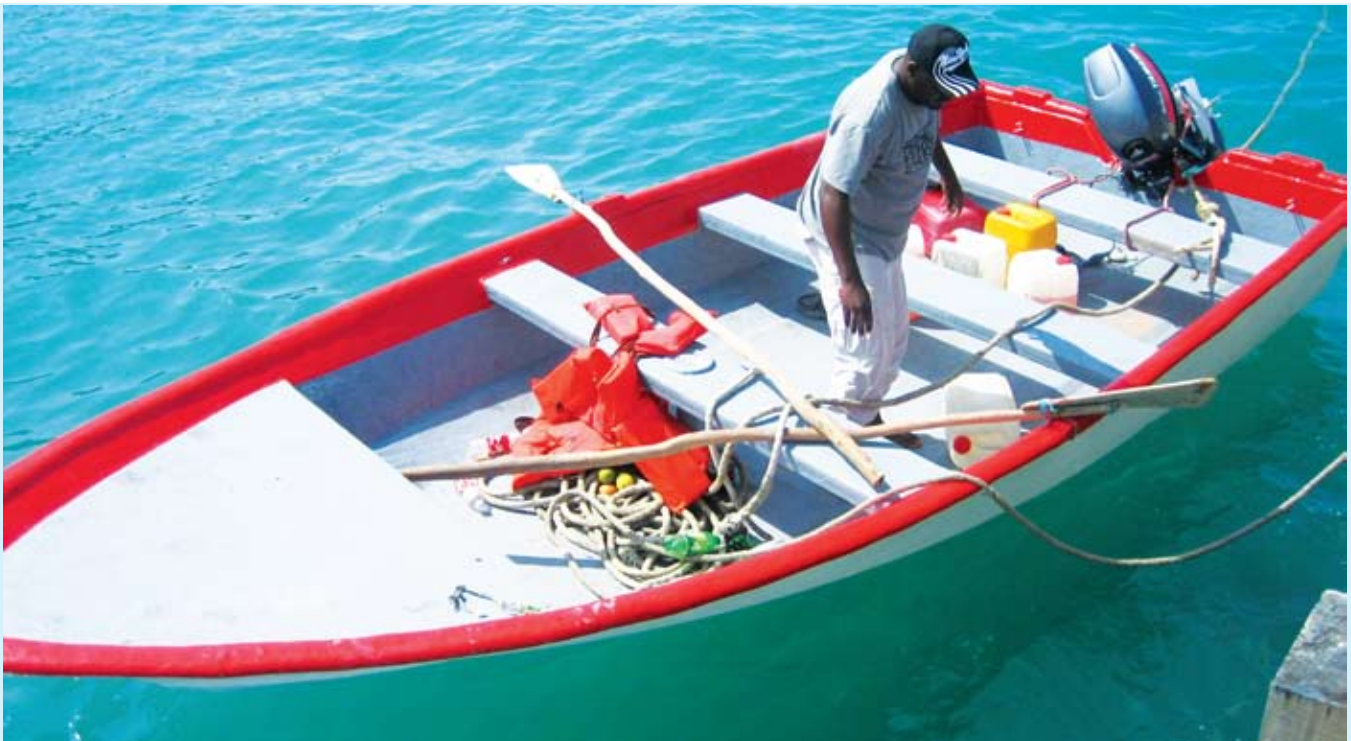
Youn (1) nan 8 anbakasyon ki fèt ak fib de vè pwojè a te fè asosyasyon pechè sidès yo jwenn nan mwa janvyè 2008.

Pandan chita pale sa a, Bernard Chauvet te rekòmande yon lòt modèl 18 pye ki sòti lakay menm konpayi a, ki koute mwens lajan pou achte ak transpòte l. Lè pwojè a fin gade pawòl pechè yo ak konesans teknik espè Food for the Poor a, pwojè a mande Xunta de Galicia pou li achte e peye pote nan peyi Dayiti yon lo 20 anbakasyon ki mezire 18 pye ak yon lòt kantite 18 anbakasyon ki mezire 22 pye kap koute kantite lajan Xunta de Galicia tap bay la. Anbakasyon sa yo ap rive nan peyi Dayiti nan mwa jen 2009 la . Pwojè a li menm ap gen pou kore aktivite sa a nan peye frè ladwan ak pou transpòte yo nan vil Jakmèl, nan achte 38 motè pou anbakasyon sa yo. Se nan chita pale ak reprezantan asosyasyon pechè yo ak lòt espè nan peyi a yap rive chwazi pwisans motè yo.