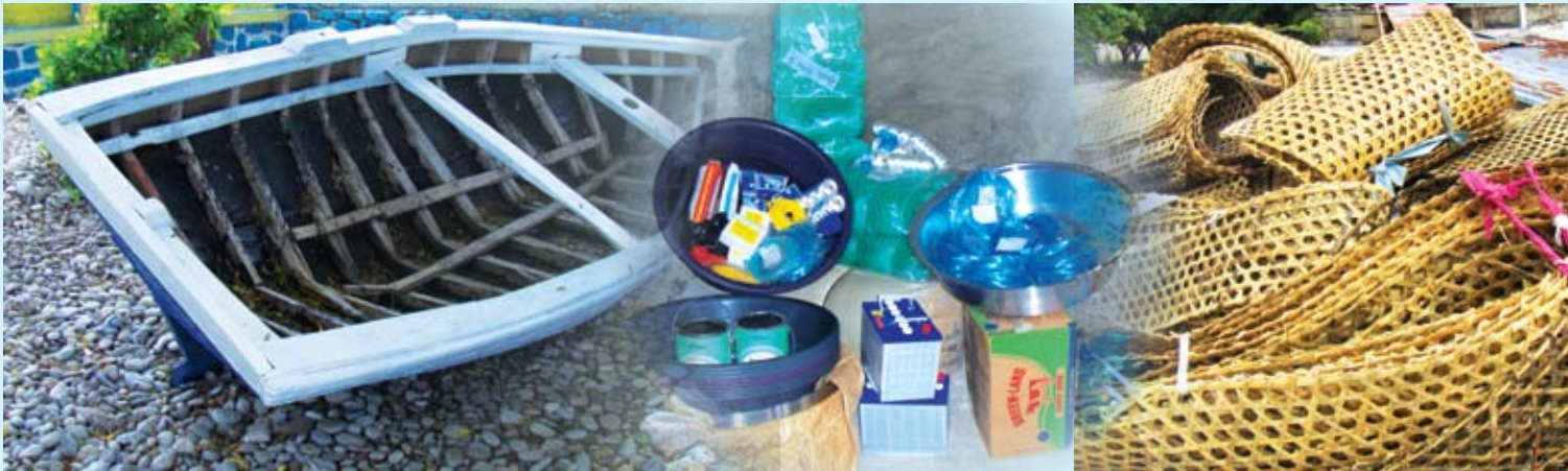
Kèk nan materyèl pèch yo, tankou liy, filè, nas ak anbakasyon pwojè a te fè pechè nan divès komin yo jwenn pou ranplase materyèl ki te pèdi pandan sezon siklòn nan. Foto sa te fèt jou ki te 25 mas 2009 la nan komin Marigo.

sa yo grenn pa grenn epi pran angajman pou'l ranplase yo, si li reyalize kalite ak tip kèk materyèl pa bon vre. Direksyon pwojè a ap tou pwofite di pechè yo ankò gen kèk materyèl pwojè a pap ka bay tankou sa kap fè nou kenbe pwason ki twò piti yo, tankou nas ki gen ti may.